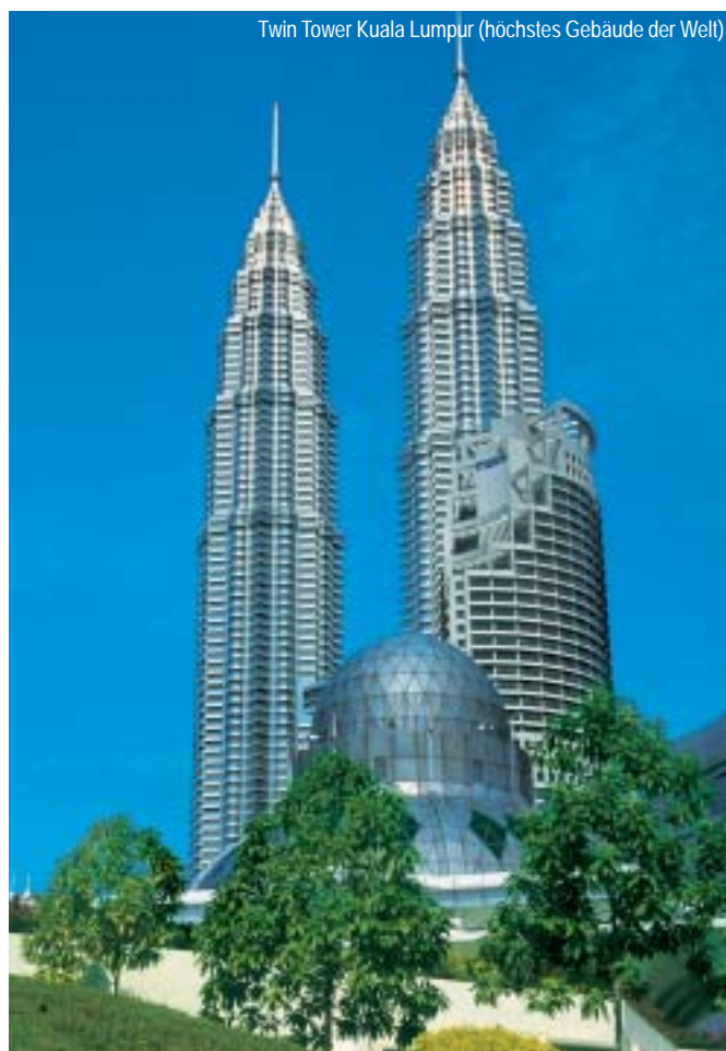
Twin Tower Kuala Lumpur (höchstes Gebäude der Welt)