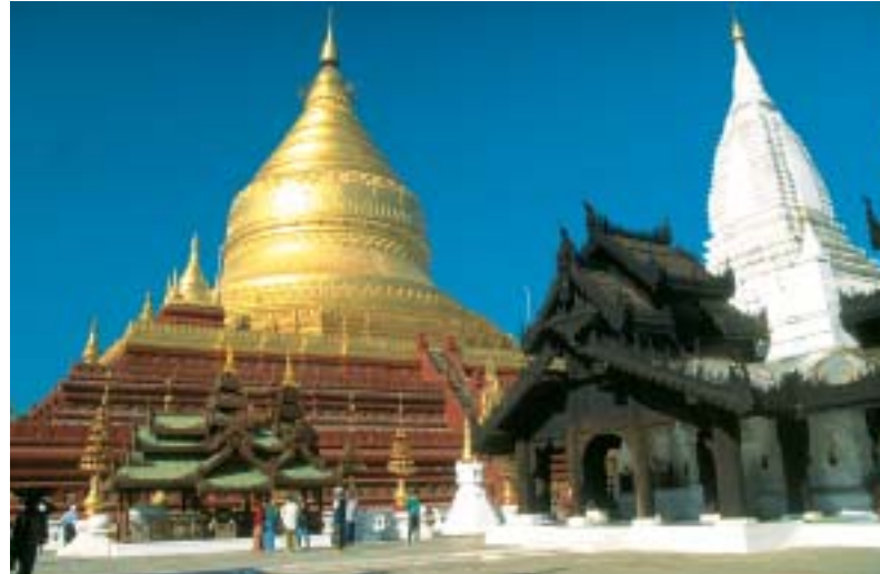
Bagan, Shwezigon Pagode

Nächtigung in Mittelklasse-/First-Class Hotels, Rundreise im klimatisierten Bus, deutschsprachige Reiseleitung, Stornoschutz; Details siehe Seite drei!