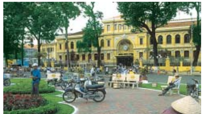
Post, Ho Chi Minh Stadt

8. Tag: Ho Chi Minh Stadt - Bangkok Transfer zum Flughafen und Flug nach Bangkok.