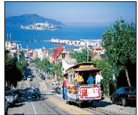
Cable Car, San Francisco mit Blick auf Alcatraz